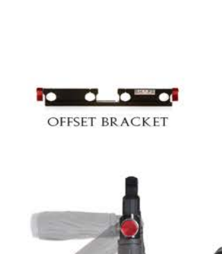
BOTTOM VIEW / VUE DU DESSOUS