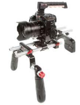
FINAL RESULT / RÉSULTAT FINAL