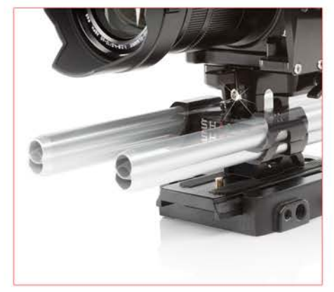
LA HAUTEUR DU ROD BLOC FRONTAL AJUSTABLE POUR INSTALLER DES ACCESSOIRES