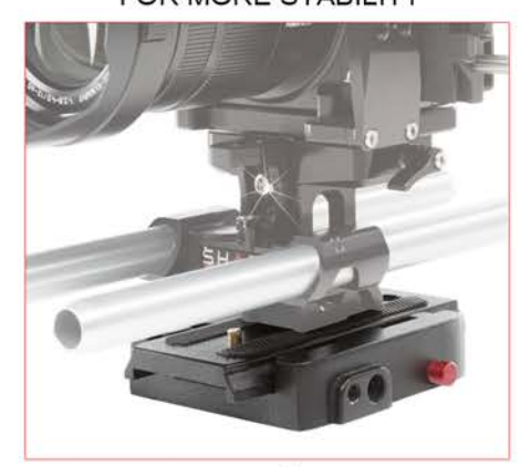
UNE PLAQUE DE RELÂCHEMENT RAPIDE EST INCLUSE POUR PLUS DE STABILITÉ