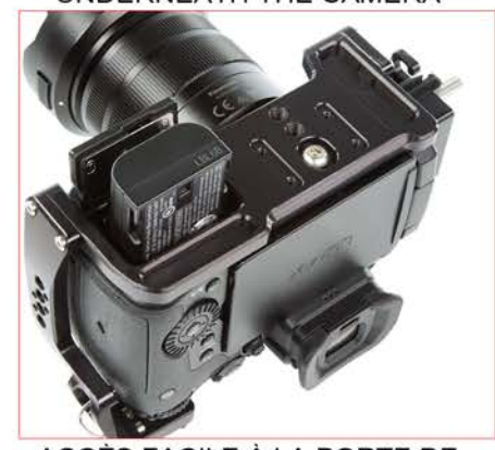
ACCÈS FACILE À LA PORTE DE BATTERIE DE LA CAMÉRA