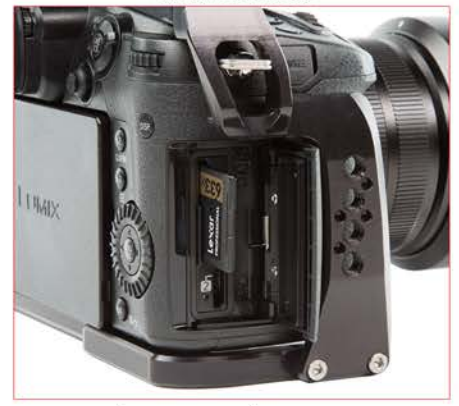
ACCÈS FACILE À LA PORTE DE CARTE MÉMOIRE DE LA CAMÉRA