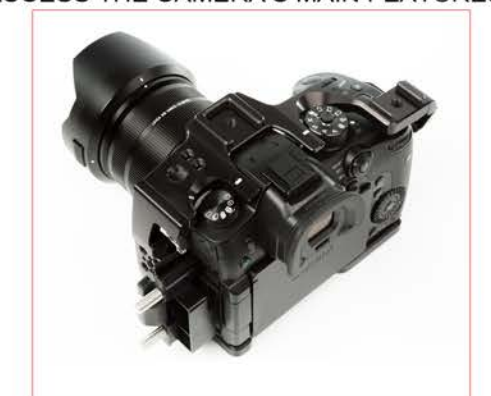
LA CAGE EST CONÇUE POUR ACCÉDER AUX FONCTIONS PRINCIPALES DE LA CAMÉRA