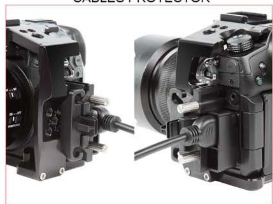
ACCÈS FACILE AU PROTECTEUR DE CÂBLES DE LA CAMÉRA